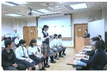
「トビタテ!留学JAPAN」の報告風景

また、「トビタテ!留学JAPAN」では、報告する生徒の中に身振り手振りをまじえるものが多く見受けられ、その様子が一ヶ月前の表敬訪問時とは大きく異なっており、このことから生徒の成長が伺えるとの感想がありました。