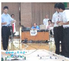
特別賞の「ギシニティ」

アイデア満載の九台区のロボットが十月に秋田県で開催される全国大会出場をかけて競い合いました。