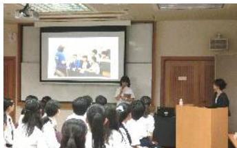
「京都市立高校グローバルリーダー育成研修」の報告風景

八月二十五日(金)に「京都市立高校グローバルリーダー育成研修」ならびに「トビタテ!留学JAPAN」の帰国報告会が、京都市総合教育センターで開催されました。